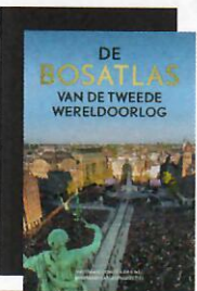
Redactie Bosatlas De Bosatlas van de Tweede Wereldoorlog Noordhoff € 39,95