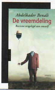
Abdelkader Benali De vreemdeling Prometheus € 16,99